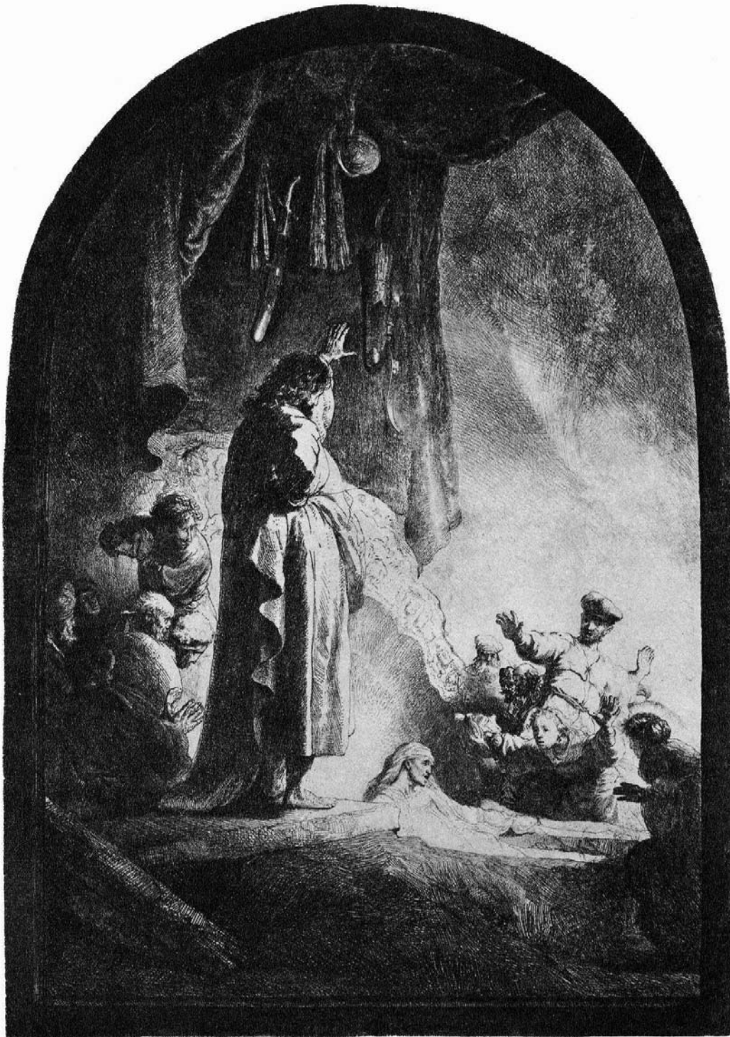
Auferweckung des Lazarus - Rembrandt

Diese Wirksamkeiten des Lichtes im Raum werden in der bildenden Kunst gezielt eingesetzt. Die Erweckung des Lazarus von Rembrandt macht das gut anschaulich: Der Verstorbene wird in einem Hell-Dunkel-Umfeld dargestellt, das ein langsames „Nach-Oben-Steigen“ bewirkt. Die Beleuchtung als äußerlich zu begründen ist ebenso absurd, wie sie als symbolisch zu begreifen. Der Bewegungsmensch im Betrachter wird durch diesen Kunstgriff zu einer inneren Aufwärtsbewegung veranlasst. Bei natürlicher Beleuchtung würde sich nichts regen.