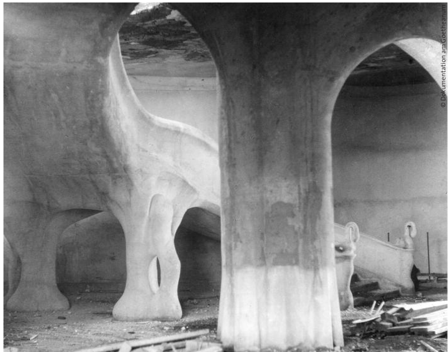
In historischen Kontext stellen: Das erste Goetheanum, Treppenhaus, 1921

haben wir schon bei der Konzeption versucht, diese Kritik einzubeziehen, etwa indem wir im ersten Bereich auf den Kontext von Rudolf Steiner schauen. Wir stellen am Ausstellungsanfang Rudolf Steiners Werk und Vita vor, aber wir tun das nicht isoliert von seiner Zeit, sondern wir wollen zeigen, wie viele seiner Ideen aus der Zeit heraus entstanden sind. So konfrontieren wir im ersten Bereich etliche Themengruppen, in denen Werke von Steiner gezeigt werden, aber auch andere von Zeitgenossen, miteinander. Dadurch wird deutlich, wie ähnlich Steiner in vielen Einzelaspekten seines Schaffens mit anderen zeitgenössischen Werken war – sei es im Mö-