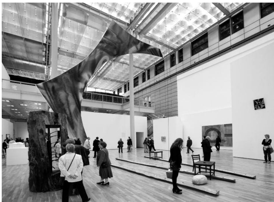
Blick in die Ausstellung: Vielfältige Bezüge und Blickverbindungen