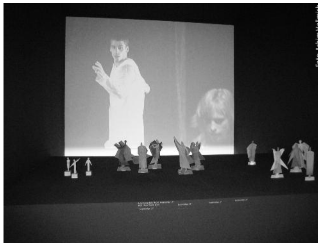
Theaterartige Atmosphäre: Präsentation von Eurythmie

zu erleben. Auf einer Grundfläche von 700 Quadratmetern und elf Metern Höhe wird der Raum «Sensing space» mit einem diffusen, sich ständig wandelnden farbigen Licht durchflutet («Goetheanum» Nr. 51/2009). Über eine Treppe schreitet man in diesen lichtdurchfluteten, pastellfarbenen Raum,