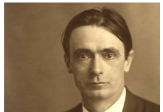
Rudolf Steiner 1907

Allgemeine Anthroposophische Gesellschaft und die Freie Hochschule für Geisteswissenschaft am Goetheanum (1923/24)